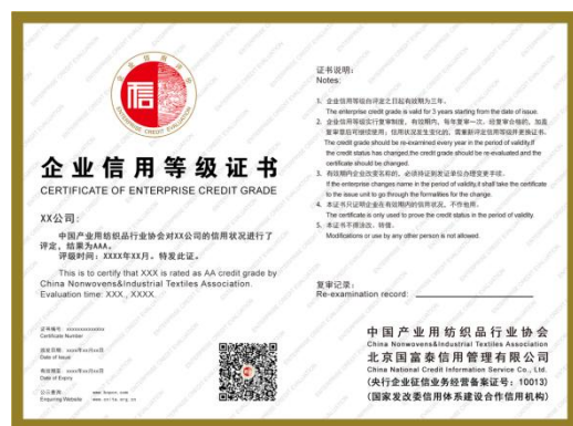
企业信用评价等级证书

中国产业用纺织品行业协会对取得信用等级评价的企业颁发统一制式、统一编码规则的标牌和证书。证书编号对应的企业信用等级状况在全国行业信用公共服务平台（ www.bcp12312.org.cn ）、中国商务信用平台（ www.bcpcn.com ）、协会官方网站（ www.cnita.org.cn ）进行查询。